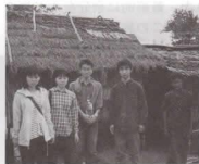
3月の1週間、クレイトム村で学校建設を手伝いました

教科書には、読み書きの練習、足し算、引き算、かけ算、割算など基本的な勉強の他、日常生活に必要な保健業等について分りやすく説明するコーナーもある。授業は決められたコマ、時間にそっておこなうわけでない。先生が言う言葉を黒板に書き、添削する、という読み書きの練習をしていたかと思うと、筆算の練習をしたり、突然、歌を唱いだしたり、楽しい雰囲気の中で進められていく。学校は勉強の場としてだけでなく、予防注射が行われたり、LWSのスタッフと村の人とのmeetingの場となるなど、皆が集まる場でもある。