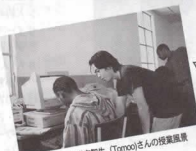
思い出となった脱衣箱生 (Tomoo)さんの成長風景

戦争のためにエチオピアを追われたり、国内で避難した人たちのために、タンザニア、ネパールに加え、エリトリアに乾パンと古着を支援したいと計画しています。